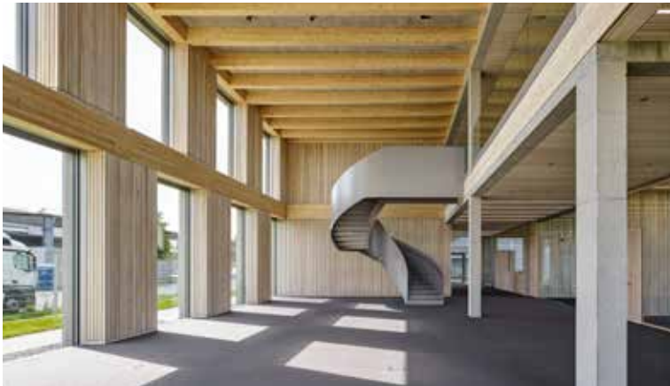
SWG Schraubenwerk Gaisbach GmbH in Waldenburg, Deutschland

El Grupo Würth es consciente de que determinados recursos naturales son finitos. Por ello, tratamos de hacer un uso más responsable de los mismos desde el punto de vista ecológico. Esto no solo implica que respetemos las leyes en vigor sobre protección medioambiental y sostenibilidad, sino que también evitamos utilizar en la medida de lo posible los recursos no renovables cuando estos no sean necesarios. Se insta a todos los empleados a adoptar medidas razonables para reducir el desperdicio de los recursos y la contaminación medioambiental.