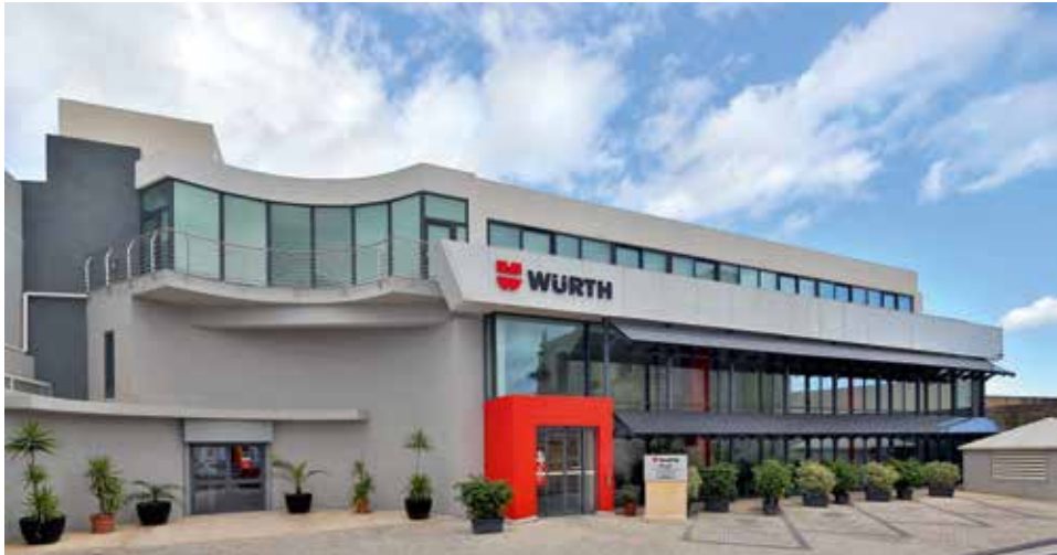
Würth Limited en Zebbug, Malta

Somos conscientes de que las restricciones mencionadas no solo se refieren a bienes físicos, sino también a información y tecnologías, las cuales tampoco se pueden transferir de forma ilícita. Las infracciones pueden provocar un gran perjuicio al Grupo Würth. Por ello se insta a todos los empleados a actuar con cautela y, p. ej., a no facilitar información por correo electrónico o por teléfono sin estar autorizados para ello. Nuestros empleados deben dirigir siempre sus dudas y consultas a los directivos o al responsable de la empresa.