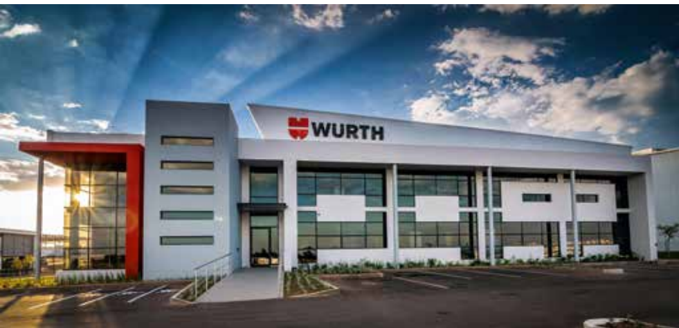
Wuerth South Africa (Pty.) Ltd. en Gauteng, Sudáfrica

Se debe aplicar especial cuidado a la hora de recopilar y procesar datos de carácter personal. Nos regimos por las leyes de protección de datos vigentes y nombramos cargos responsables de su cumplimiento.