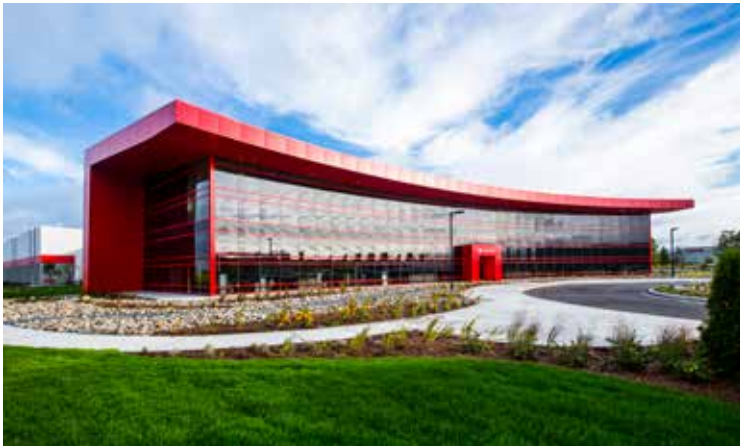
Würth Canada Ltd., Ltée in Guelph, Kanada

Esto no se aplica a las actividades ocasionales de redacción, conferencias y actividades similares que no afecten a los intereses legítimos del empleador. Acogemos con satisfacción el compromiso voluntario de nuestros empleados.